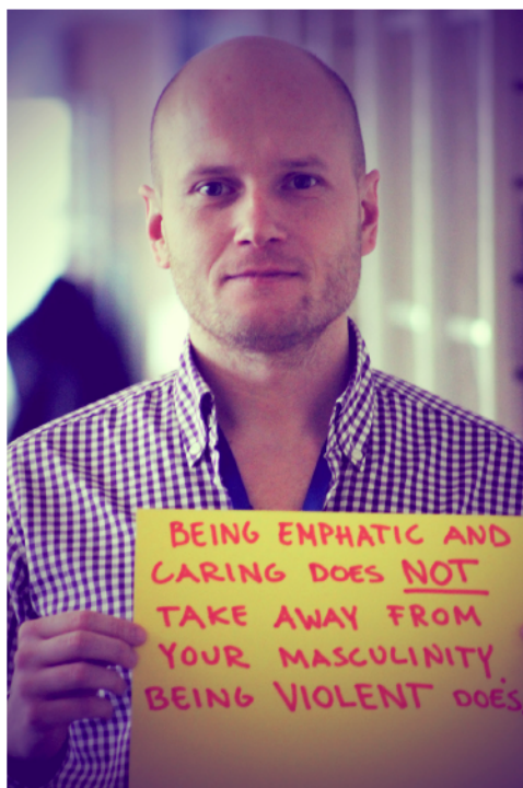
Campania EIGE pe Facebook: Bărbații împotriva violenței împotriva femeilor.

În 2012, EIGE a realizat un studiu privind „Colectarea de metode, de instrumente și de bune practici în domeniul violenței domestice (astfel cum sunt descrise în domeniul de interes D al Platformei de acțiune de la Beijing)”. În cadrul acestuia a fost elaborată o colecție de resurse, de metode și de instrumente, precum și de bune practici cu privire la prevenirea și la protecția față de violența domestică. Studiul s-a concentrat pe trei domenii: formarea în domeniul problematicei de gen, sensibilizarea și serviciile de sprijinire a victimelor .