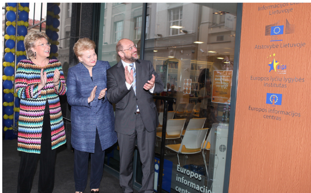
Viviane Reding, vicepreședinte al Comisiei Europene, Dalia Grybauskaitė, președinta Lituaniei, și Martin Schulz, președintele Parlamentului European, în timpul ceremoniei de inaugurare a Casei Uniunii Europene, în mai 2013.

EIGE contribuie la procesul decizional printr-o informare de bună calitate privind problematica egalității între femei și bărbați în Europa și oferă expertiză de înalt nivel Comisiei Europene, statelor membre, țărilor implicate în procesul de aderare și Parlamentului European.