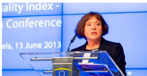
Virginija Langbakk, directoarea EIGE, la conferința de lansare a Indexului egalității de gen, la Bruxelles, în iunie 2013.

Repartizarea timpului este un alt domeniu în care disparitățile dintre femei și bărbați sunt mari. Una dintre explicațiile acestei situații larg răspândite este faptul